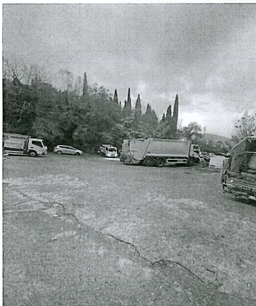
Foto 1 Posizione autocompattatore nel parcheggio Selvapiana