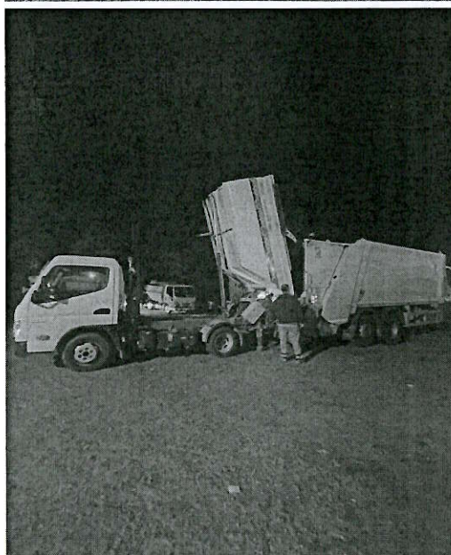
Foto 2 Operazione di trasbordo nel parcheggio Selvapiana

In linea generale, in caso di effettiva necessità di effettuare il trasbordo in zone con leggera pendenza, è necessario tenere in considerazione e rispettare quanto segue.